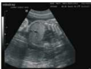
Fötus Abdomen und Rippen